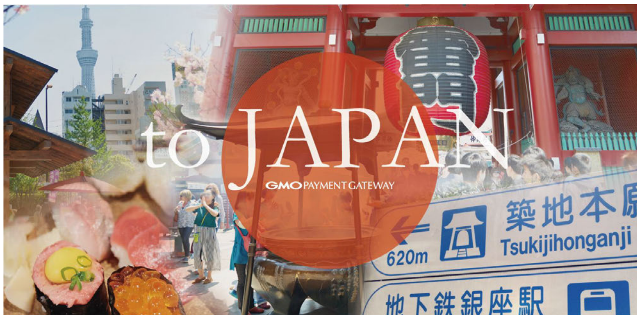
<「インバウンドマーケティング」コンテンツイメージ>

すでに、株式会社日の丸リムジン様に先行してご利用いただいております。インバウンドビジネスにおいて有用であることご好評のため、全ての加盟店向けに提供することとなりました。