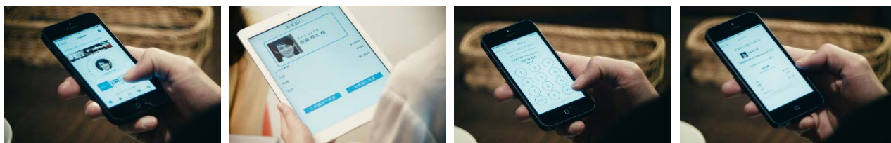
①お客様:店舗にチェックイン ②店舗:金額入力 ③お客様:金額確認・暗証番号入力(決済完了) ④お客様:レシートの通知

一方、店舗側は、「GMO Pallet」へのお申込み手続き後(*2)、店舗専用の「GMO Pallet レジ」アプリ(現在 iOS 対応端末のみ。Android 版は今秋提供予定)をモバイル端末(スマートフォン・タブレット)にダウンロードし、GMO-PG が発行する ID・PW を登録することで、お客様(消費者)に「GMO Pallet」による決済手段を提供できるようになります。決済処理業務の効率化に加え、来店・販売履歴など顧客情報を容易に管理することが可能なため、リピート客率・利用単価の向上の施策へ有効活用していただくことができます。